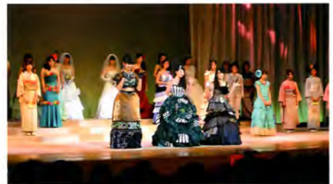
ファッション創造科 作品発表フィナーレ