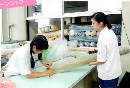
インターンシップ