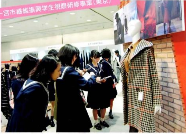
一宮市繊維振興学生視察研修事業(東京)