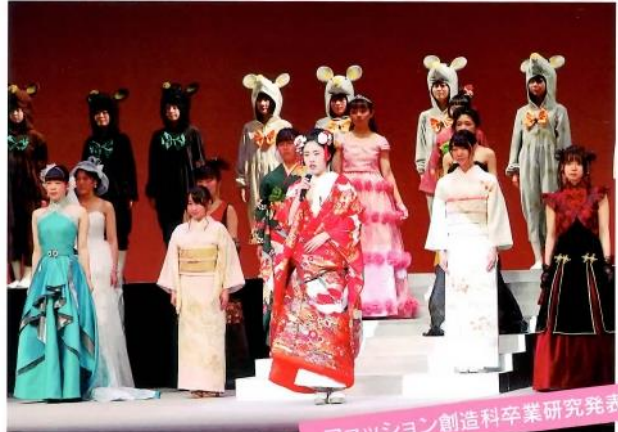
ファッション創造科卒業研究発表会