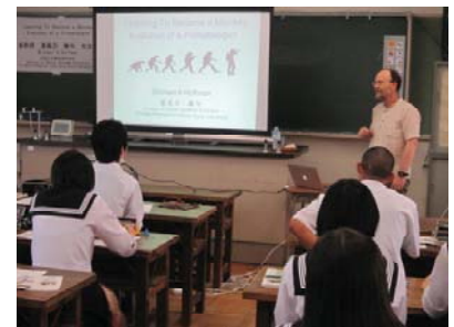
熱心に聴く生徒たち

該当教科 SSH 発展 対象生徒 普通科3年理系生物選択者 日時場所 7月16日（水）本校 生物講義室 実施内容