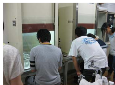
無菌操作をする生徒たち