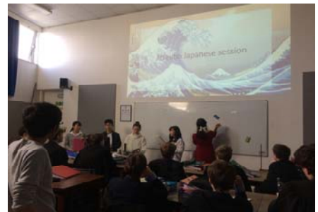
プレゼンテーションの様子

オックスフォードやロンドンの博物館でアストロラーベワークショップを始めとする各ワークショップや見学ツアーに参加し、英国の科学・文化に触れる。優れた学問・芸術を目の当たりにすることで、知識や教養を深めると共に、科学的想像力の根源的な力を養う。