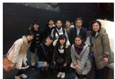
ロンドン科学博物館見学

また、伝統あるイギリスの文化や歴史、学問に触れ、国内に留まらず世界で活躍する人材になりたいという意思が高まり、今後の学習へのモチベーションをあげたようだ。