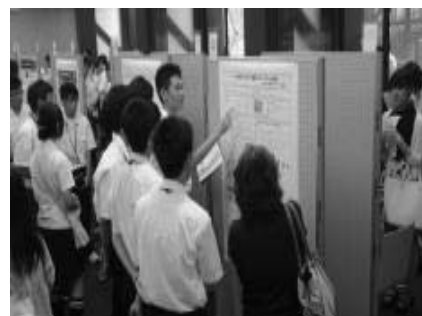
ポスター発表の様子

課題研究に取り組む高校生が、大学の研究者から直接アドバイスを受けられる機会を作る。このような機会を作ることで、高校生の課題研究の質を向上させ、意欲や論理的に考える力を高める。また、高校生同士が互いの研究を知り、議論することで研究を深める。