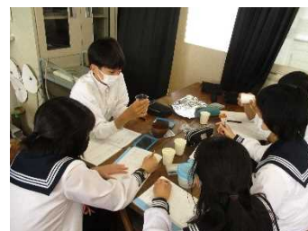
「紙コップの不思議を探る」の様子

科学的探究方法を学ばせることを目的に、紙コップに熱湯を注ぐとコップの下の机面が曇る原因を解明する探究活動を実施した。紙コップやプラスチックコップ、ビニール袋などを用い、班ごとに原因を追究し、その結果をクラスで発表した。