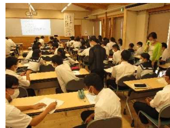
プレゼンテーション研修